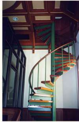
บันไดเวียนจัดทำใหม่เมื่อพ.ศ. ๒๕๔๔ Spiral staircase renovated in 2001

ตึกแสงอาทิตย์ ตั้งอยู่ถัดจากตึกนารีสโมสรไปทางทิศใต้ บางท่านที่เคยอาศัยอยู่บ้านนริทร์เรียก “ตึกอาทิตย์” เหตุที่ท่านเจ้าของบ้านตั้งชื่อนี้ คงเป็นเพราะท่านเกิดวันอาทิตย์ เป็นตึก ๓ ชั้น รูปทรงเหมือนหอคอย ภายในมีบันไดเวียนขนาดใหญ่เวียนโค้งขึ้นสู่ชั้น ๒ และชั้น ๓ สุดบันไดมีประตูออกไปสู่ภายนอก ซึ่งเดิมเป็นสะพานเชื่อมไปยังตึกฟุ้งบุญและตึกอื่นๆ แต่ปัจจุบันคงเหลือเป็นกันสาดเหนือบันไดทางขึ้นตึก ส่วนตึกฟุ้งบุญและตึกอื่นๆ ในกลุ่มเดียวกันได้ถูกรื้อถอนสร้างเป็นตึกบัญชาการหลังแรก