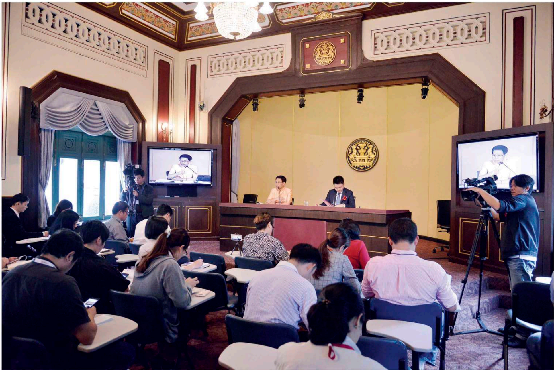
◆ การใช้งานศูนย์แถลงข่าวรัฐบาล