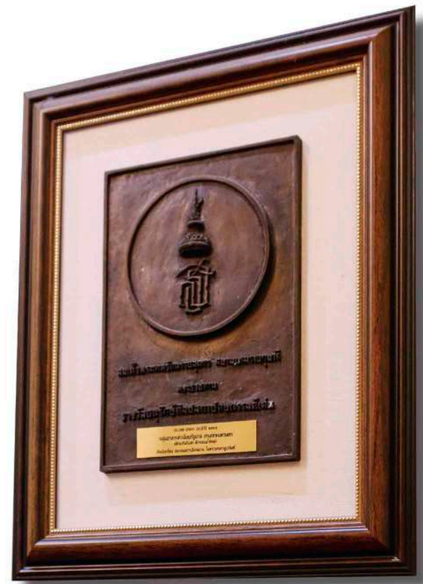
♦ รางวัลอนุรักษ์ศิลปสถาปัตยกรรมดีเด่น ประเภทอาคาร ประจำปี พ.ศ. ๒๕๔๘ ประดับบนผนังทางเข้า ตึกนารีสโมสร