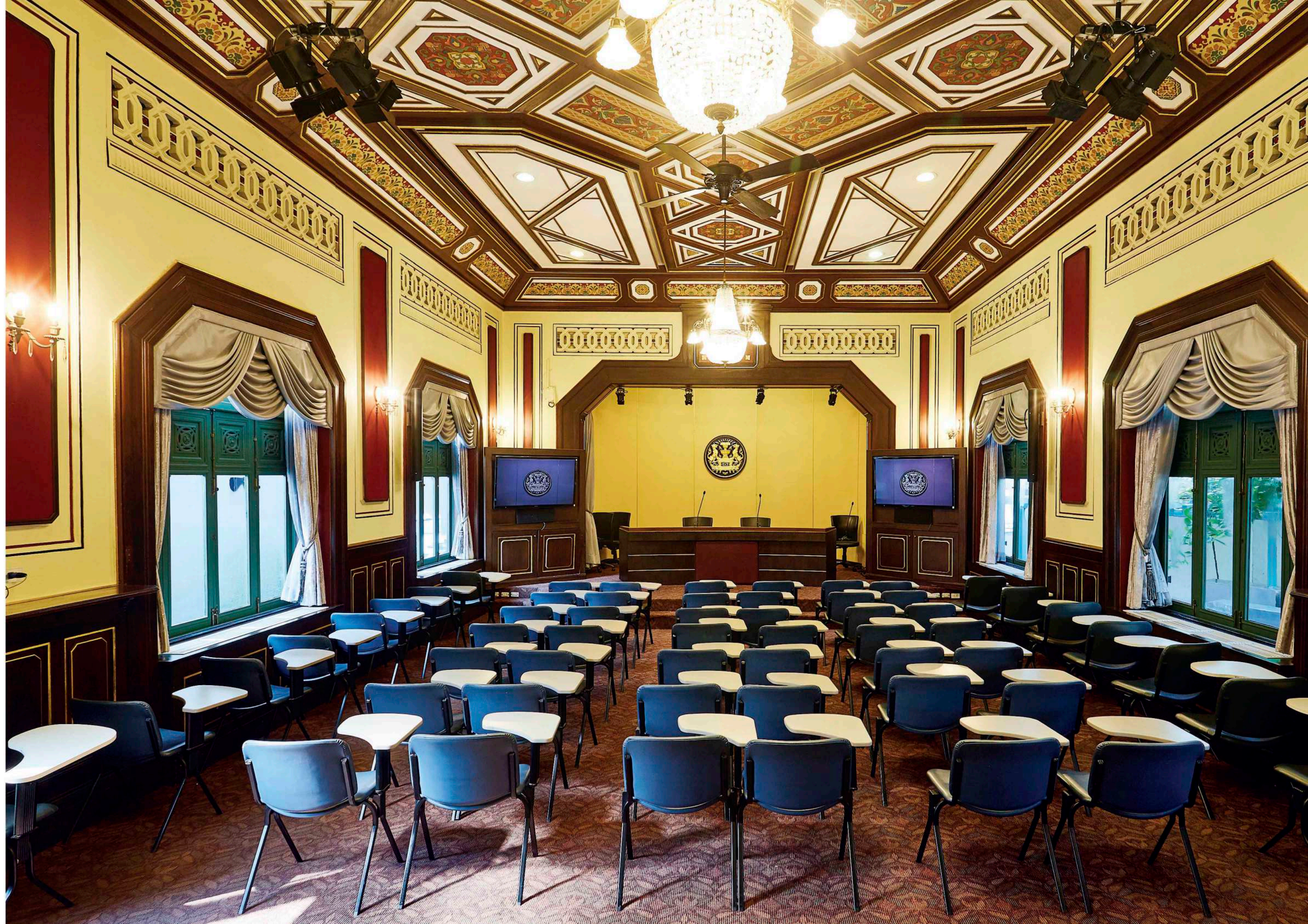
◆ ศูนย์ถาวรรัฐบาล ตึกนารีสโมสร