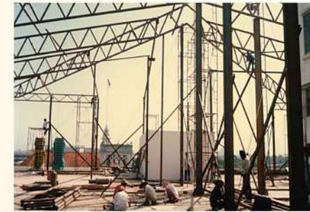
ห้องประชุมคณะรัฐมนตรี สร้างเมื่อ พ.ศ. ๒๕๓๒ Later, in 1989, the meeting room for the Cabinet was built on the roof of the building.