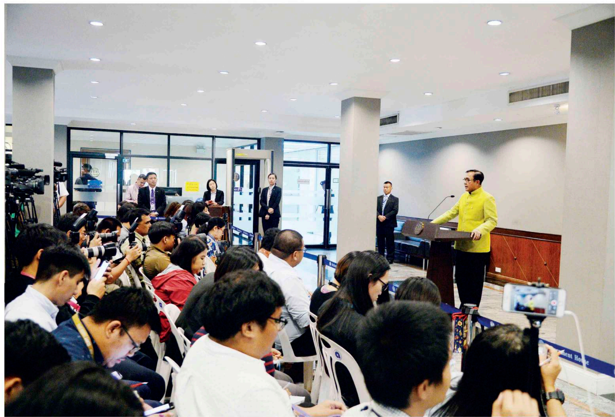
◆ พื้นที่โล่งชั้น ๑ ตึกบัญชาการ ๑ ใช้จัดกิจกรรมประชาสัมพันธ์และจัดการแถลงข่าวของนายกรัฐมนตรี