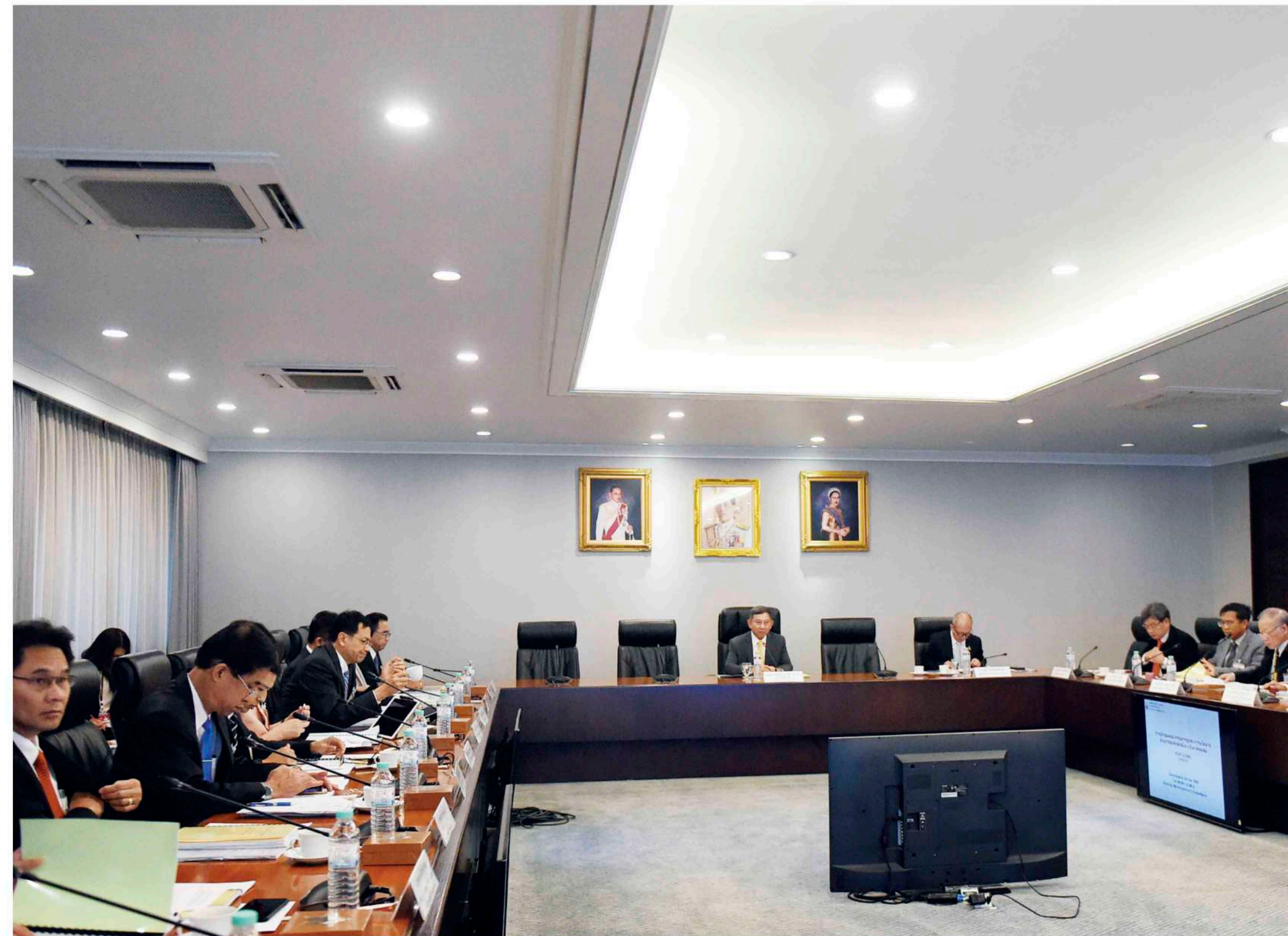
◆ ห้องประชุม ๓๐๑ ชั้น ๓