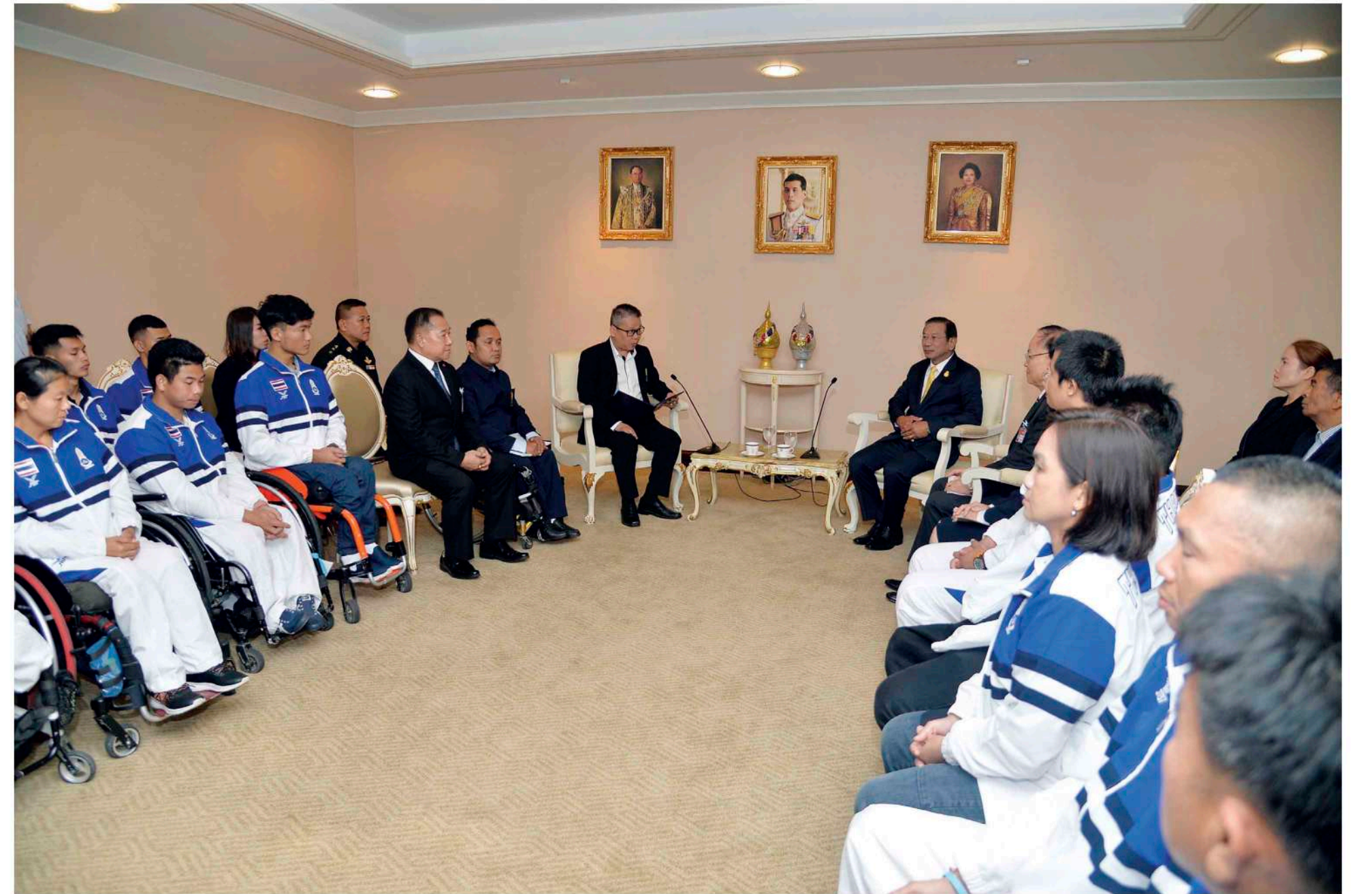
◆ การใช้งานห้องรับรอง ๑ ตึกบัญชาการ ๑