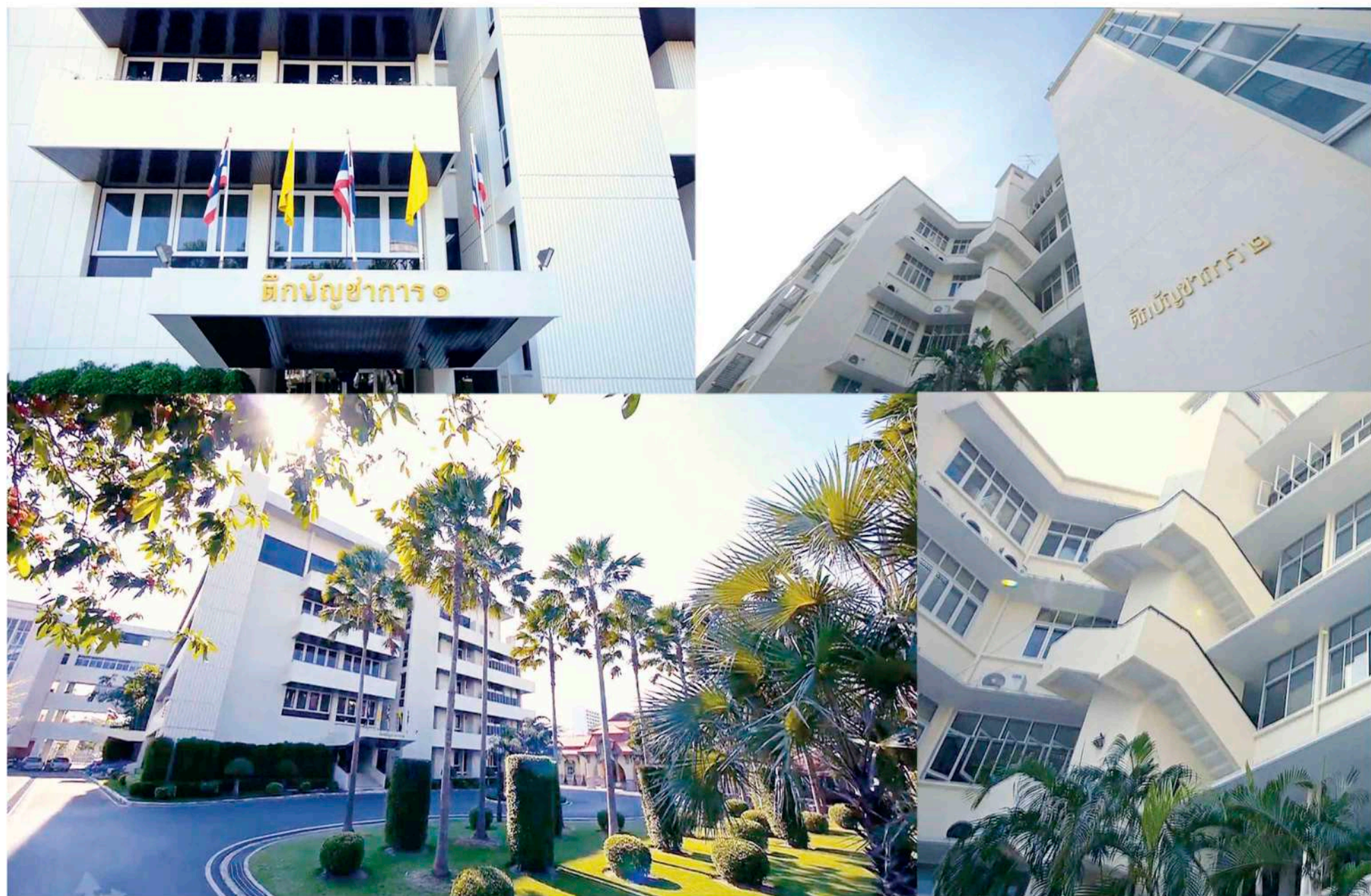
◆ รูปแบบตึกบัญชาการ ๑ และตึกบัญชาการ ๒ ก่อนการปรับปรุง