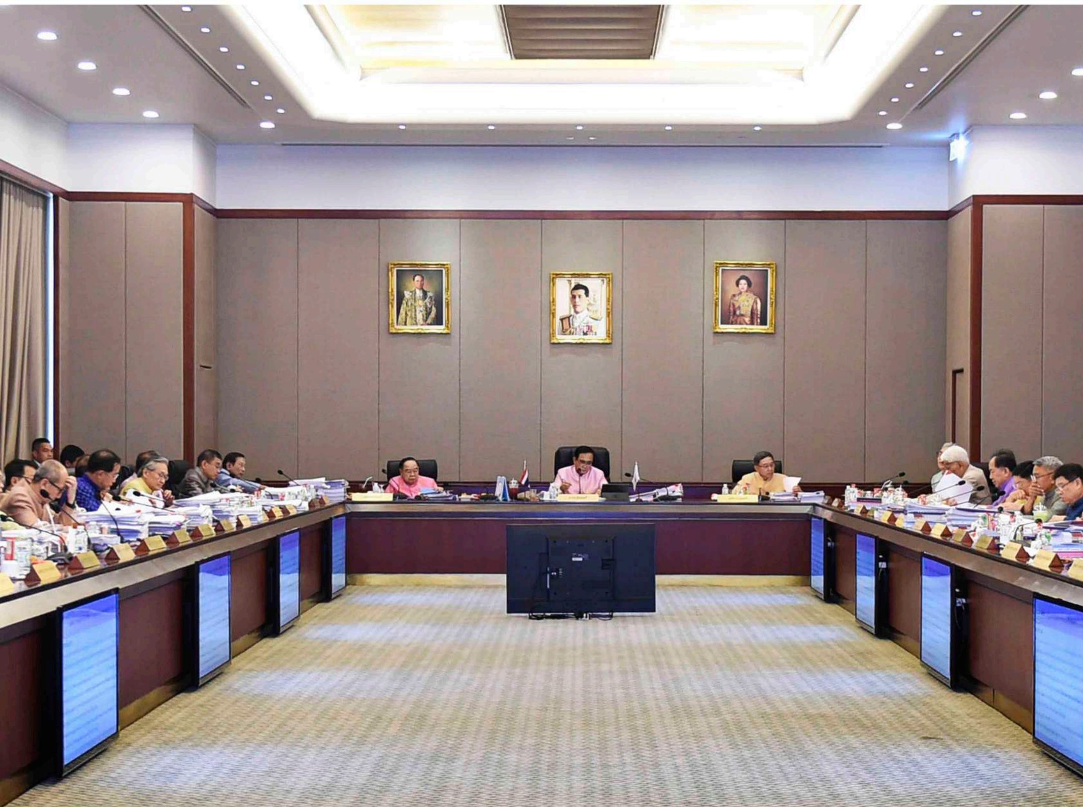
◆ ห้องประชุมคณะรัฐมนตรี ชั้น ๕