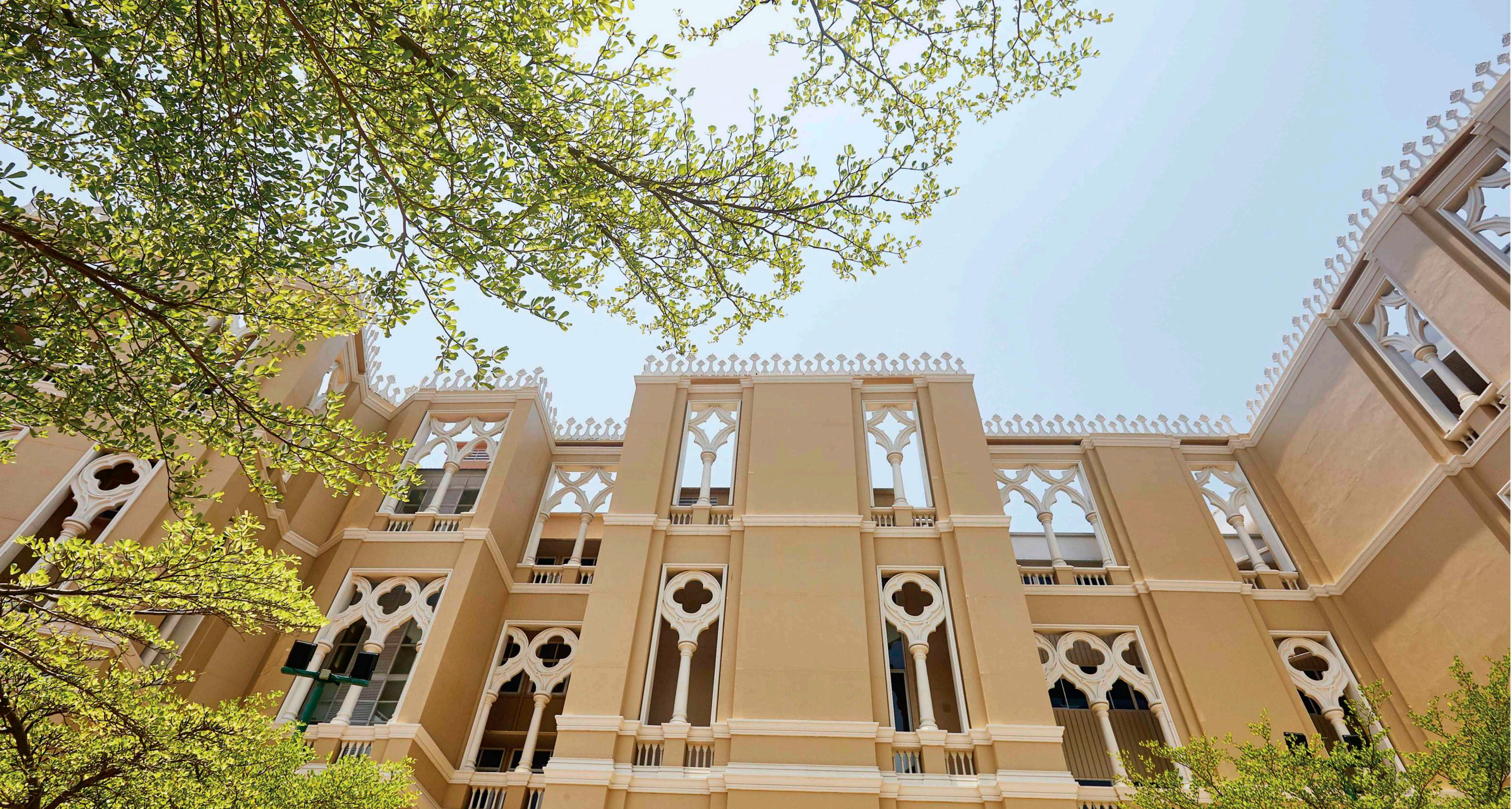
♦ สถาปัตยกรรมตกแต่ง ภายนอกอาคาร